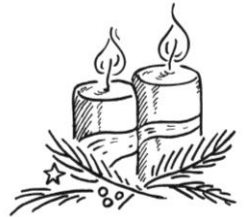
2. Advent: Die Erwartung wecken