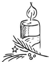
1. Advent: Die Umkehr wagen