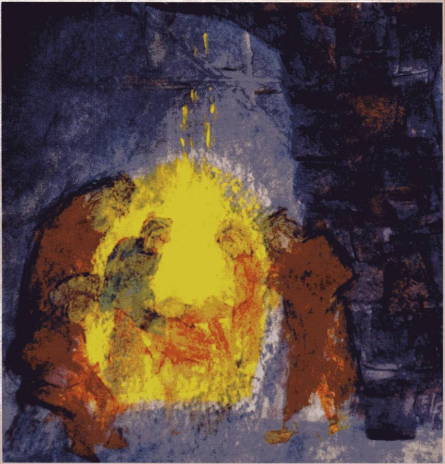
© Editha Lennartz-Finger, „Heilige Nacht unter Brücken“

PFARREI ST. MARGARETA KURATSBENEFIZIUM ST. PETER